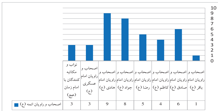
نمودار اصحاب و راویان شیعی ری به تفکیک ائمه (ع) در قرن دوم و سوم هجری

محدثان دیگری چون عطیة بن نجیح (خویی، ۱۴۱۰ق، ۱۰: ۹)، قاسم بن محمد رازی (همان، ۱۴: ۵۷)، یحیی بن محمد رازی (همان، ۲۰: ۹۰)، حسن بن عبدالله رازی تمیمی (عطاردی، ۱۳۵۱ش، ۲: ۲۵۲)، حسن بن علی خیط رازی (طوسی، ۱۴۲۰ق، ۴۲۰)، محمد بن یوسف مقری (طوسی، ۱۴۱۷ق، ۱۷) به‌رغم کمی منقولات‌شان یا عدم نقل از آن‌ها در منابع حدیثی شیعه، در شکل‌گیری و رشد مدرسه حدیثی ری نقش داشته‌اند. افزون بر حضور محدثان شیعه، متکلمانی نیز در این شهر حضور داشته‌اند که در سده دوم از علی بن احمد بن علی خزّاز رازی (استرآبادی، ۱۴۲۲ق، ۷: ۳۱۹) و در سده سوم از محمد بن خلف رازی (نجاشی، ۱۴۰۸ق، ۲: ۳۸۱) و نیز متکلم حاذق، ابن قیبه رازی (همان، ۲۸۸) می‌توان یاد نمود.